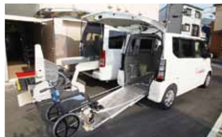
リフト付きワゴン車